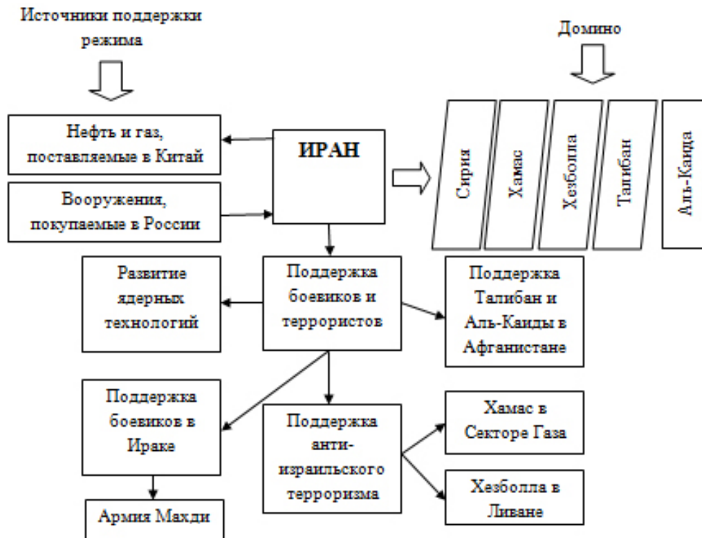
Рисунок 3. Иран как стержень государств-изгоев (согласно концепции домино М. Схеффера [26, с. 60])

сти государств, а также интересы других великих держав, связанных с регионом противостояния.