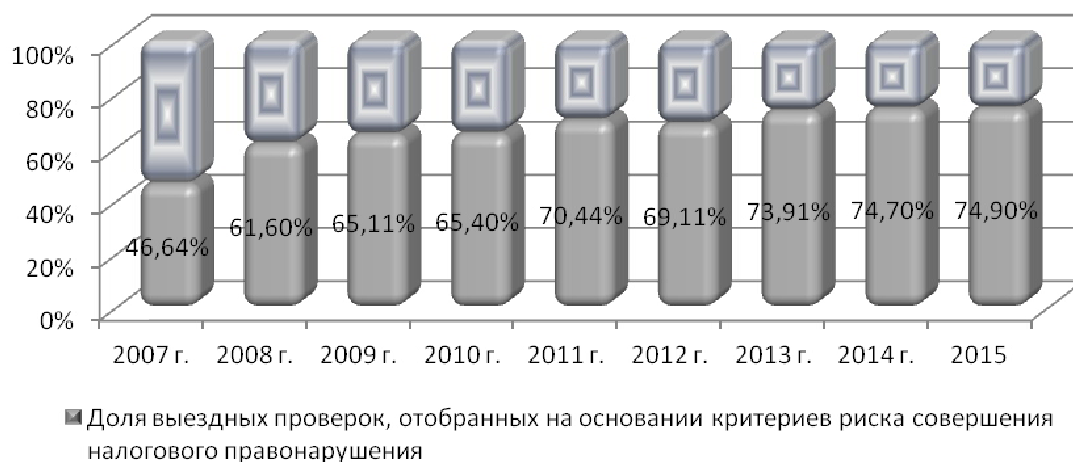
Рис. 1. Доля проверок, отобранных на основании критериев риска совершения налогового правонарушения, в общем объеме выездных проверок проведенных налоговыми органами Республики Мордовия