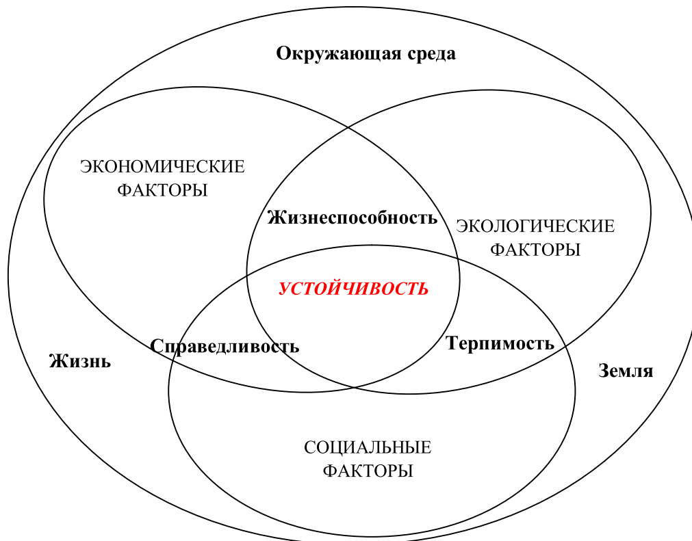
Рис. 1. Устойчивость человека в представлении Карсона

Мировой авторитет по вопросам экологических и социальных последствий различных проектов, эксперт Всемирного банка Гудлэнд ( Robert Goodland ) представляет иной взгляд на устойчивость человека, рассматривая эту категорию независимо от процессов устойчивого развития. Под устойчивостью человека он предлагает понимать сохранность человеческого капитала [4]. Авторы концепции человеческого капитала Шульц ( Theodore William Schultz ) и Беккер ( Gary Stanley Becker ) определяли человеческий как имеющийся у каждого человека запас знаний, навыков, мотивационных установок, трудовую и географическую мобильность, здоровье, профессиональный опыт и т.д. [5]. Таким образом, в соответствии со взглядом на проблему Гудлэнда устойчивость человека формируется совокупностью факторов: здоровье, образование, жиз-