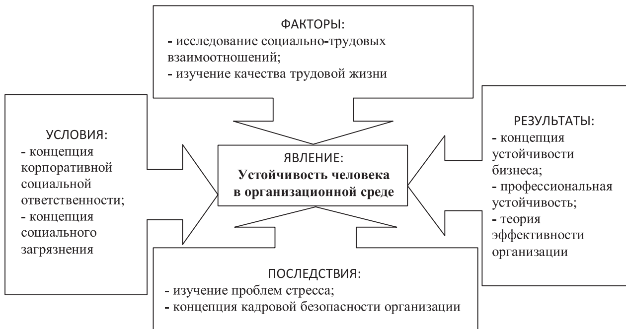
Рис. 4. «Научное пространство» изучения вопросов устойчивости человека в организационной среде

Признательность. Работа выполнена при поддержке Минобрнауки России в рамках базовой части Государственного задания на выполнение государственных работ в сфере научной деятельности (задание №2014/2-752).