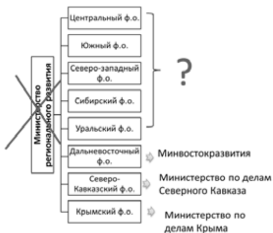
Рисунок 7. Государственные органы, ответственные за территориальное развитие

Структура органов государственной власти указывает на то, что ответственность за территориальное развитие не несет ни одно ведомство. Министерство регионального развития в 2014 году было упразднено. Вопросами регионального развития стали заниматься несколько министерств, которые каждое отдельно координирует одну территорию (Крым, Дальний Восток и Северный Кавказ, рисунок 7). В такой ситуации, все вопросы территориального развития сводятся к приоритетному освоению трех регионов, что не решает накопившиеся в стране проблемы, а порождает новые.