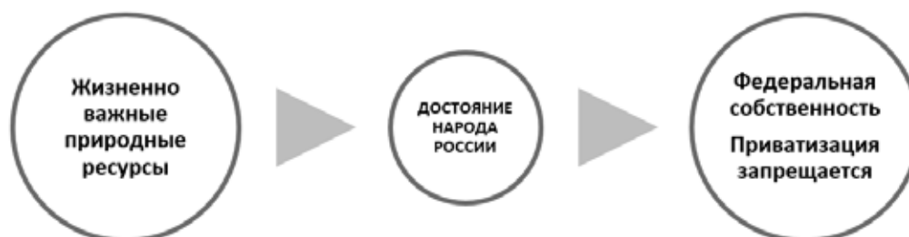
Рисунок 4. Собственность на природные ресурсы

Предлагаемая формула отлична от действующей модели. Полезные ископаемые, за исключением общераспространенных, как часть природных ресурсов признается Достоянием народа России (ст. 106) [1] и находится в исключительной федеральной собственности (Рисунок 4).