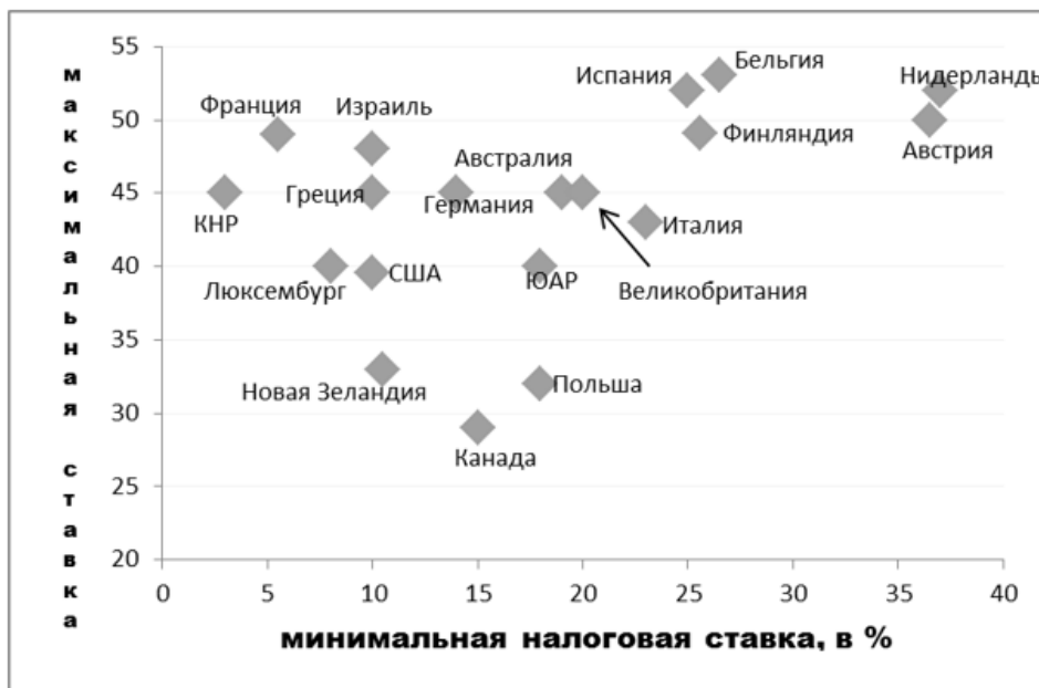
Рисунок 3. Ставки по налогу на доходы физических лиц (по данным МВФ)

Отказ вводить прогрессивную шкалу по примеру западных стран (Рисунок 3) только сохраняет несправедливое распределение, при котором наиболее состоятельные граждане получают