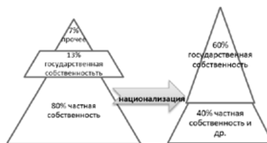
Рисунок 8. Структура собственности в либеральной и постлиберальной модели

знанные достоянием Народа России, а также иные материальные и нематериальные объекты, владение, пользование и распоряжение которыми осуществляется преимущественно в целях достижения всеобщего блага и социальная эффективность использования которых при нахождении в иных формах собственности была бы существенно ниже» (ст. 105 Проекта Конституции) [1]. В состав государственной собственности входят жизненно важные природные ресурсы (водные, воздушные и лесные ресурсы, недра и полезные ископаемые, за исключением общераспространенных, исчезающие виды растений и животных). Их приватизация запрещается.