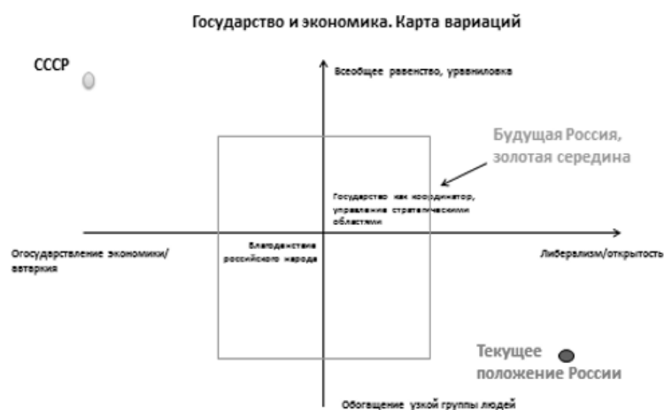
Рисунок 1. Вариации роли государства в экономических процессах

устраняясь из тех сфер, которые по определению закладывают основы процветания сильного государства [4]. Частный собственник в сфере здравоохранения и образования в силу своих