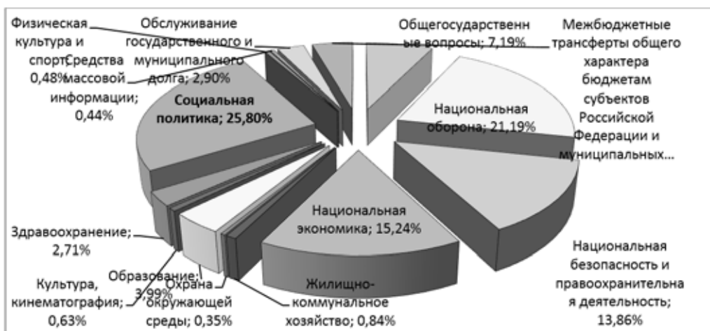
Рисунок 5. Собственность на природные ресурсы

3. Государство не устраняется, а несет полную ответственность за достижение целей России (ст.102) и развитие всех сфер жизнеустройства и жизнедеятельности страны (ст. 15) [1]. Этот подход контрастирует с закрепленным принципом господства стихии рынка, оказание помощи со стороны государства только в период кризиса. Государственные органы должны нести полную ответственность за результаты управленческих решений: при таком механизме ЦБ отвечал бы за обвал курса рубля, Минфин и МЭР за показатели экономического роста, а не перекаладывали бы всю вину на внешние обстоятельства. Поле ответственности должно охватывать следующие отрасли (Таблица 1.)