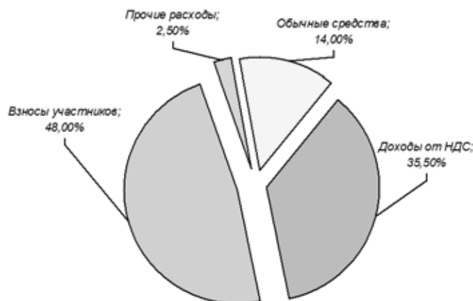
Рисунок 2. Структура доходов бюджетного плана ЕС 2014–2020

4. прочих доходов – 2,5%, представляющих собой налоги на доходы чиновников ЕС, доходов от ставок по банковским вкладам, взносов от стран, не входящих в ЕС, возврата неиспользованных средств, штрафов юридических лиц за нарушение законодательства Евросоюза и т. п.