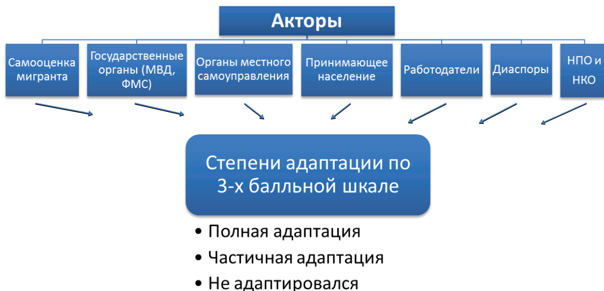
Рис. 2. Оценочная модель социальной адаптации мигрантов

экономического положения, обеспечивающего достойную жизнь в новом социуме и другие экономические условия.