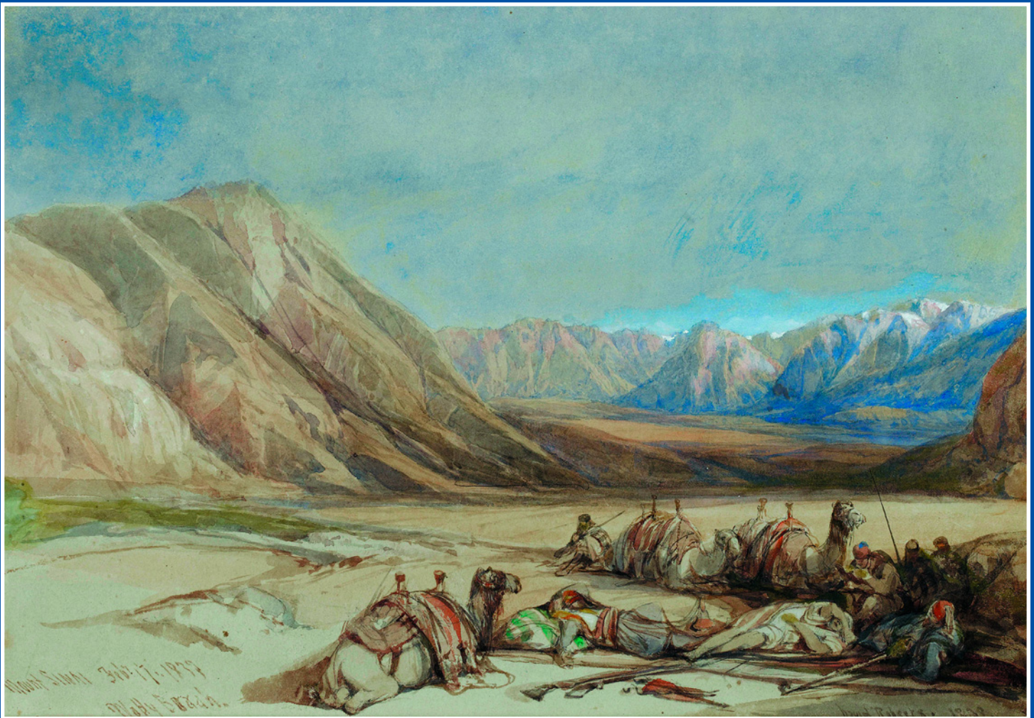
Отдых каравана у горы Синай. Худ. Дэвид Робертс. 1839 г. Галерея аукционного дома Bonhams.

врачеванием. Во время гонений на христиан при императоре Диоклетиане они были схвачены и после долгих пыток обезглавлены. Накануне же, когда братья размышляли, быть ли им похороненными в общей могиле, стоявший рядом верблюд обрел дар речи и поддержал их решение. К слову, в то, что человека, живущего в святости, после смерти белый верблюд унесет на небо, верили и в Средней Азии.