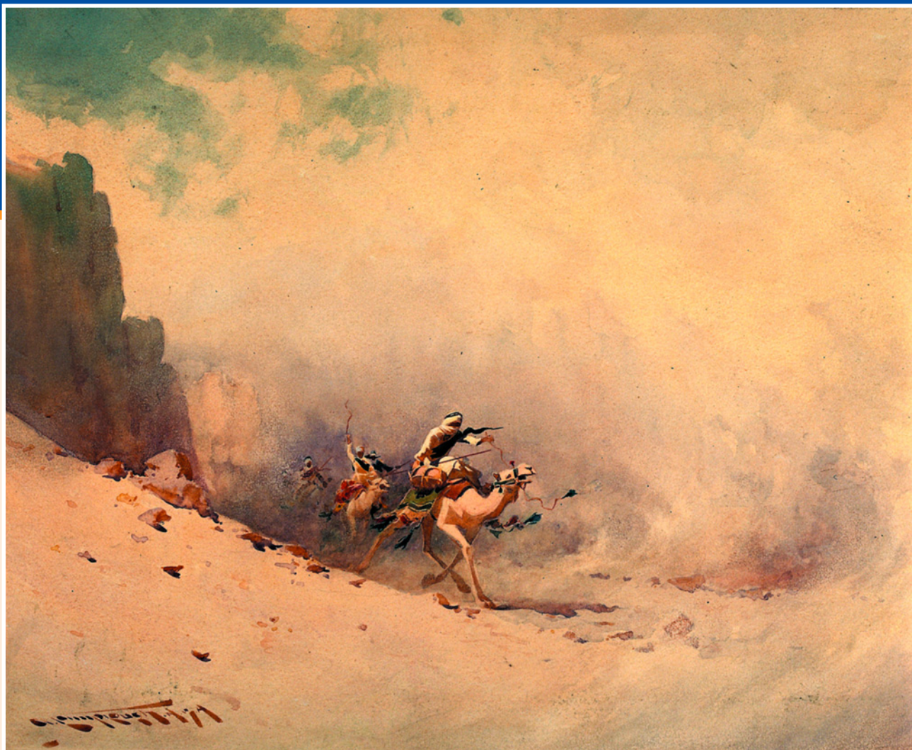
Песчаная буря в пустыне. Худ. Огастес Ламплож. XIX в. Лондонская национальная библиотека.