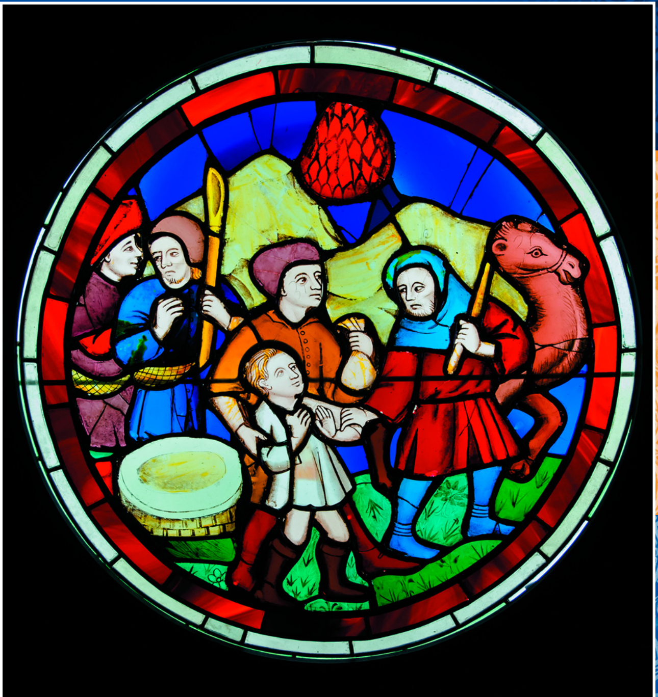
Верблюд на витраже XV века, отображающем ветхозаветное предание об Иосифе и его братьях. Из парижской капеллы Сент-Шапель.

и самки, для животных разного возраста и разной масти, для обозначения тех или иных качеств, и того, чем они занимаются – пасутся ли, ведут ли караван, участвуют ли в военных экспедициях. Есть отдельные наименования для уставшего верблюда. Особым словом обозначается происхождение и порода: молочные верблюды, верблюды для езды, верблюды для размножения, верблюды на убой.