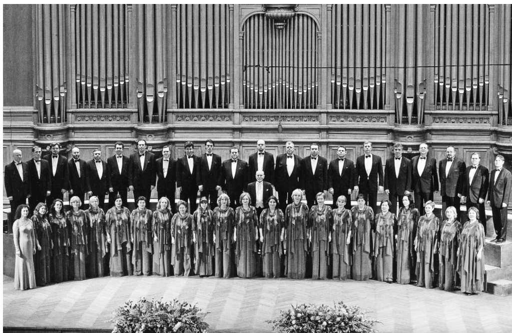
Московский камерный хор под управлением В.Н. Минина, 2007 г.

оно прозвучало и было записано полностью (1988). Впоследствии, в середине 1990-х годов, Минин создает еще один аудиовариант на CD. Интерес маэстро к этому сочинению не иссякает и по сей день — свидетельство тому концертные программы коллектива.