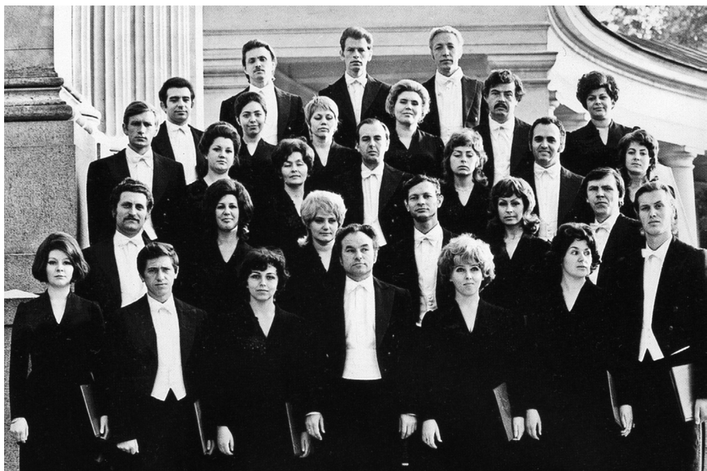
Первый состав Московского камерного хора, 1970-е гг.

ненность глубоким смыслом. Отмечая данную черту как основную в отборе певческого материала, вновь обратимся к русской музыке, где исполнительский дар дирижера проявился особенно ярко и многогранно. Почему же именно феномен русской музыкальной культуры становится таким притягательным для творческих поисков маэстро? Казалось бы, идея камерного исполнительства, пришедшая с Запада, должна была определить несколько иные приоритетные позиции в плане выбора репертуара. Напомним, что в то время — в середине 70-х годов прошлого столетия — существовали большие хоровые составы, исполнявшие преимущественно крупные формы.