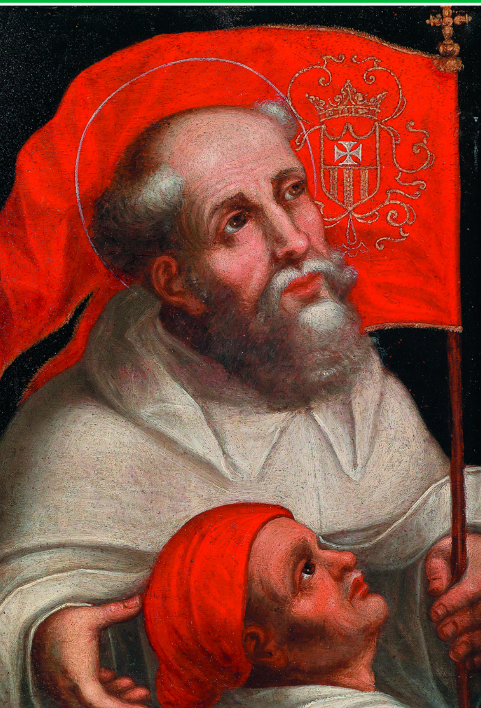
Святой покровитель со штандартом Ордена мерседариев и человек. Неизвестный художник испанской школы начала XVII в. Галерея аукционного дома Dorotheum.

нищенствующий монашеский орден Пресвятой Троицы был организован в 1198 году. Девизом ордена, более известного под именем тринитариев, стала латинская фраза «Gloria Tibi Trinitas et captivis libertas» – «Слава Тебе Троица, а пленным – свобода». При этом, помимо главной цели – выкупа пленных христиан из мусульманского плена, орден занимался также попечением о больных и бедных.