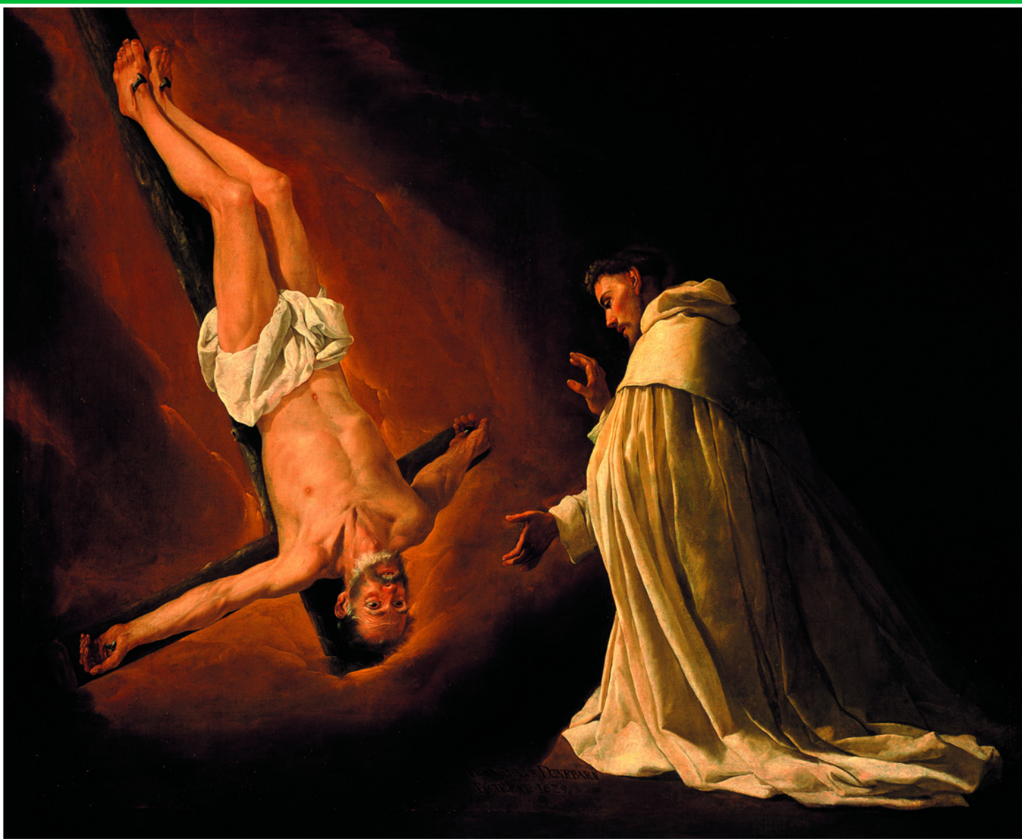
Видение св. Петром Ноласко распятого апостола Петра. Худ. Франсиско де Сурбаран. 1629 г. Музей Прадо, Мадрид.

узнаваемыми по белым плащам с красно-синим крестом, закрепилось прозвище «ослиного ордена». И хотя средства для выкупа тринитарии добывали, главным образом, сбором милостыни, за четыре с половиной столетия своего существования (в годы революции 1789 года во Франции их деятельность была запрещена) орден выкупил из мусульманского плена более 30 тысяч невольников. Среди спасенных из алжирского плена в 1580 году был и знаменитый автор «Дон Кихота» Сервантес.