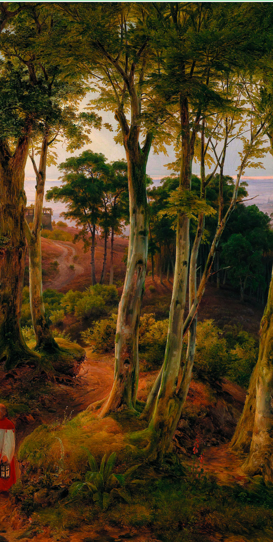
Монастырь в лесу. Худ. Карл Фридрих Лессинг. 1834 г. Галерея аукционного дома Dorotheum.

он поначалу целиком в порядке частной инициативы – в пятнадцать лет Педро Ноласко потерял отца, и, унаследовав его огромное состояние, стал тратить его на освобождение христиан, оказавшихся в мусульманском рабстве. Дав обет содействовать их свободе а, если потребуется, предложить в качестве выкупа и самого себя, Петр Ноласко исполнил его, оставшись в 1226 году в плену в Африке вместо нескольких отпущенных на волю христиан, и лишь через несколько месяцев был выкуплен братьями по ордену.