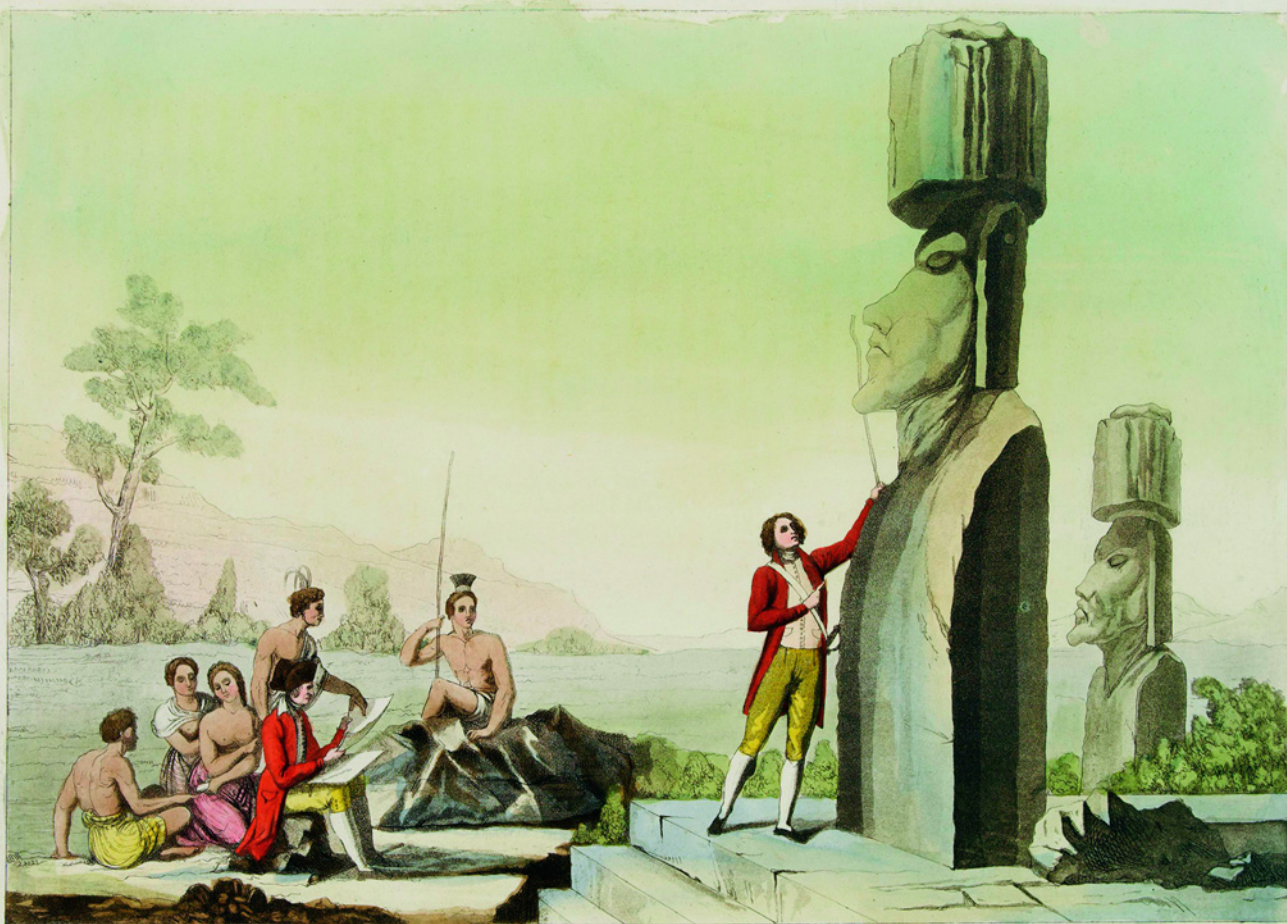
Открытие статуй острова Пасхи. Гравюра Карло Ботигелла по рисунку Джулио Феррарио. 1827 г.

Нет ответа и на вопрос, почему в основе письма ронго-ронго лежат именно иероглифы, коль скоро оно, по мнению большинства ученых, является подражанием европейскому письму, занесенному испанскими колонистами.