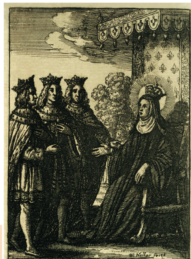
Королева Батильда и ее сыновья Хлотарь, Хильдерик и Теодорих. Гравюра Вацлава Холлара. XVII в. Библиотека редких книг Томаса Фишера, Торонто, Канада.

В 1880 году на суд посетителей Парижского салона, одной из самых престижных художественных выставок Франции, была представлена картина «Сыновья Хлодвиги II». Ее автор, французский живописец-жанрист Эварист Виталь Люмине красками поведал трагическую историю двух сыновей средневекового короля Нейстрии и Бургундии. За то, что они восстали против отца, пока тот находился в крестовом походе, юношам, по велению матери, королевы Батильды, подрезали сухожилия, чтобы они не могли двигаться, и, положив на плот, отправили по Сене, предоставив их жизнь на волю Божью. Люмине был хорошо известен своей приверженностью к точности в изложении сюжетов из жизни средневековой Франции, и реальность истории, положенной в основу полотна, казалось, не вызвала сомнения. А меж тем, ни у одного из историков, прежних