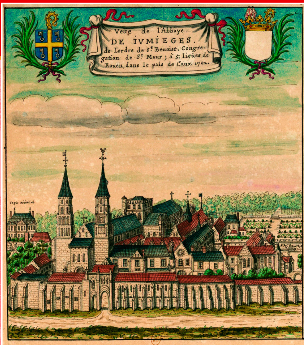
Аббатство Жюмьеж, где оформилась легенда о сыновьях Хлодвига. Гравюра Луи Будена. 1702 г. Национальная библиотека Франции, Париж.

ды мятежным королевичам перебили голени, посадили их в лодку и пустили вниз по Сене. Но они остались живы. Плот прибило к берегу у аббатства, которое находилось в излучине Сены в глухом труднодоступном лесу, где их нашел аббат Филибер. Монахи