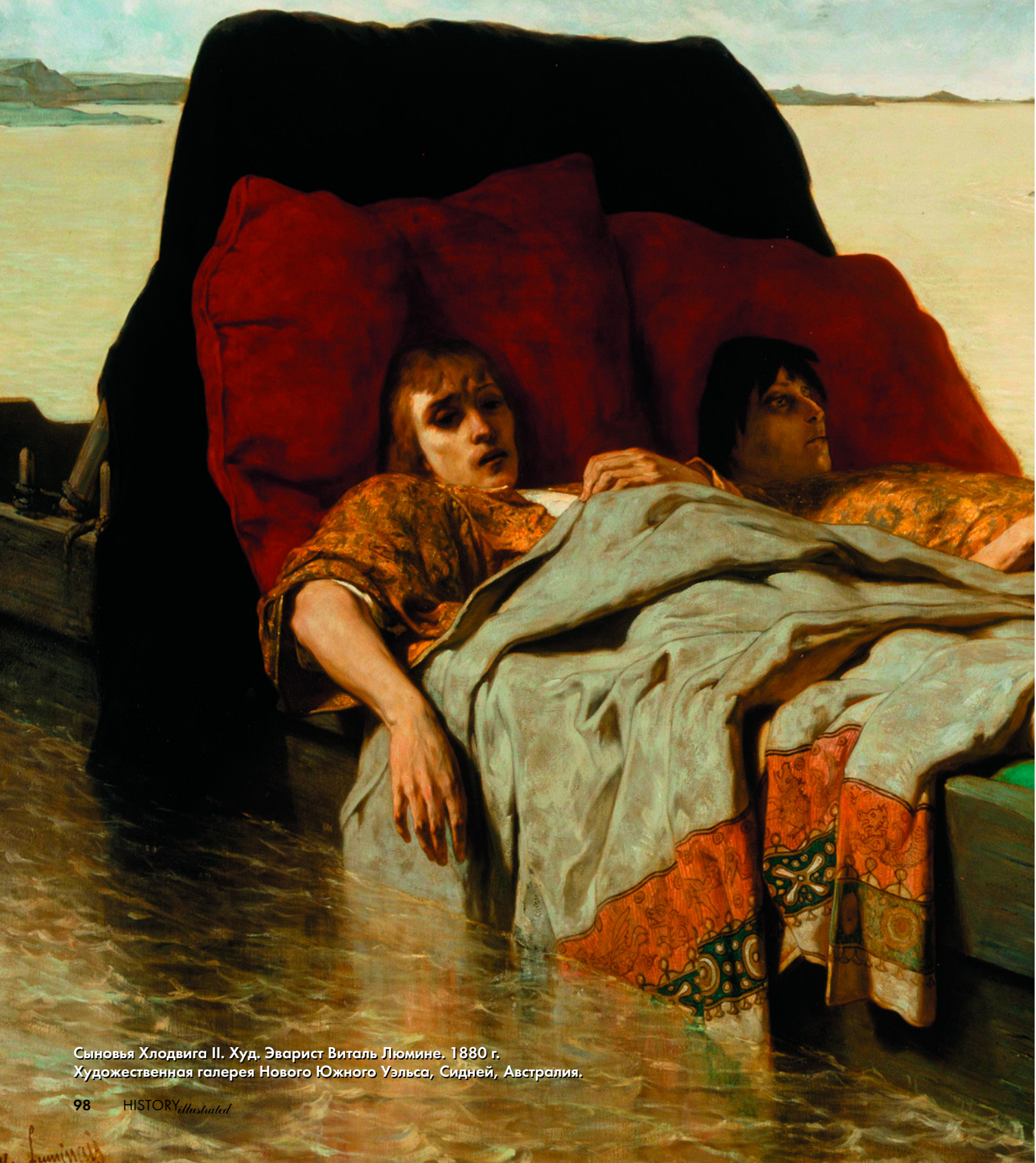
Сыновья Хлодвига II. Худ. Эварист Виталь Люмине. 1880 г. Художественная галерея Нового Южного Уэльса, Сидней, Австралия.