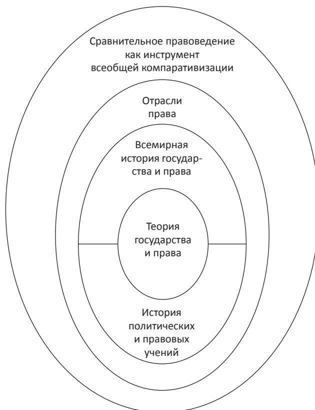
Схема № 1. Структура юридических знаний в зрелом постмодернизирующемся обществе

Одновременно с тем, что к принципиально новому рубежу развития подошло Сравнительное правоведение, качественного обновления требует концепция и практи-