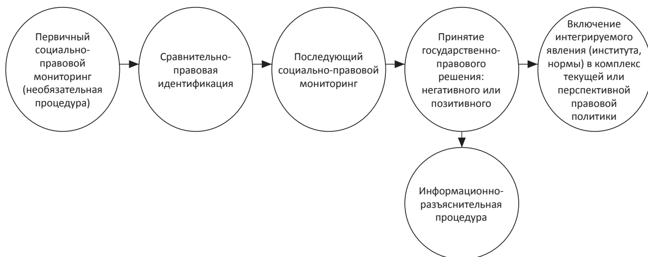
Схема № 4. Сравнительная правовая политика как цикл взаимодействующих процедур

В свое время мы обращали внимание на то, что в то время как правовой мониторинг является способом рационализации законодательства, устранение пробелов и противоречий в нем, социально-правовой мониторинг представляет из себя более сложный, комплексный процесс, в который входит не только исследование права, но и изучение состояния общественного мнения по поводу права. Причем целесообразно дополнить указанный процесс сравнительно-правовым анализом отечественной правовой реальности и мировой правовой практикой. Социолого-правовые исследования, по нашему мнению, не требуют традиционных подходов общей социологии, в том числе проведения массовых общенациональных опросов абсолютно всех социальных групп. Скорее, более оптимальными являются глубинные интервью (с глазу на глаз) и интервью в фокусных группах (размером в 7–12 человек), позволяющие выявить не столько позицию, сколько мотивацию опрашиваемых. Таким образом, предполагалось, что социально-правовой мониторинг должен предшествовать сравнительной правовой политике, заранее предоставляя информацию о желаемых изменениях (заимствования) в праве. Однако, как мы склонны считать в данный момент, предварительный социально-правовой мониторинг – это необязательная процедура, а вот последующий социально-правовой мониторинг обязателен, поскольку тестирует предполагаемое правовое заимствование на социальную и политическую приемлемость (см. Схему № 4).