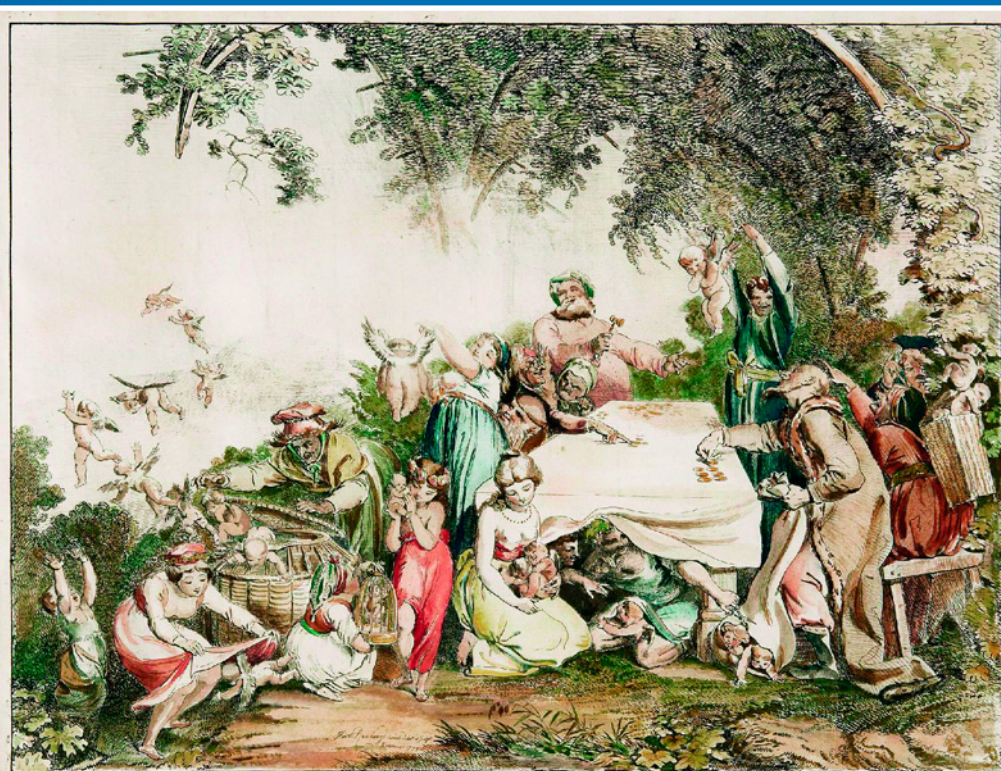
Аукцион бога любви. Иллюстрация к поэме Гете. Худ. Иоганн-Генрих Рамберг. 1799 г.

В средневековой Европе профессия аукционера впервые появилась с декретом Людовика IX, изданным в 1254 году. В его обязанности входило устройство торгов, на которых наследники могли быстро превратить имущество, оставшееся после кончины владельца в деньги или же собрать сумму, необходимую для погашения долга.