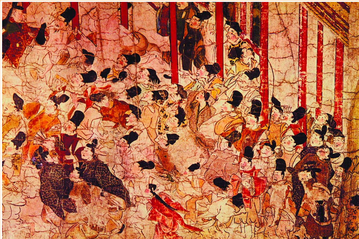
Внизу: Горожане, торопящиеся по своим делам. Неизвестный художник. XVI в.

Вплоть до конца XVIII века похожим словом – «Катай» – пользовались и в Европе, где оно появилось с легкой руки венецианского купца Марко Поло, впервые прозвучав в 1298 году в его «Книге о разнообразии мира».