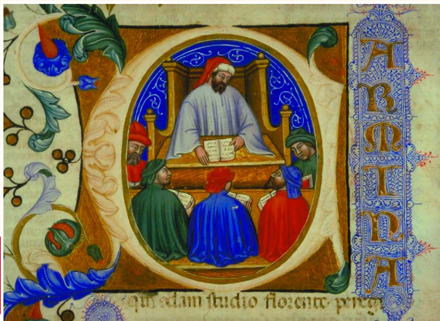
Амадей. Боэций, наставляющий учеников. Миниатюра Из книги I «Утешение Философией Боэция». 1385 г. Глазго, университетская библиотека.

Естественно, перед преподавателями и студентами стоял вопрос, на что существовать. Часть университетских преподавателей, например, в Болонском университете, получала пособия от городских властей, а начиная с XIII века – специальное жалование за работу. Что касается студентов, то они тоже могли рассчитывать на стипендию – университеты предоставляли своим членам не только кров, но и стол и деньги на карманные расходы. Кроме того, школяры могли получать дотации от частных лиц, либо зарабатывать в качестве домашнего учителя или переписчика. На худой конец, можно было наняться слугой к профессору или более богатому собрату. Иногда студенты становились приживалами в богатых домах,