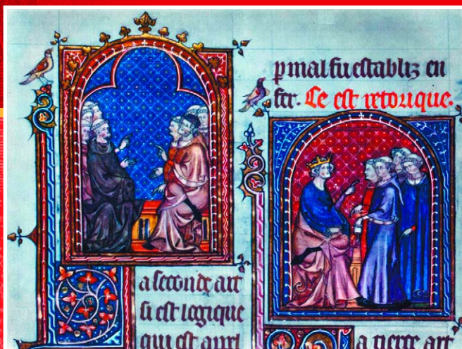
Уроки логики и риторики. Миниатюра из французского манускрипта, 1574 г.

ский, возникший на основе юридической школы, основанной в 1088 году знаменитым правоведом и знатоком римского права того времени Ирнерием. Лекции Ирнерия оказались столь популярны, что к нему стали стекаться ученики со всех концов Европы.