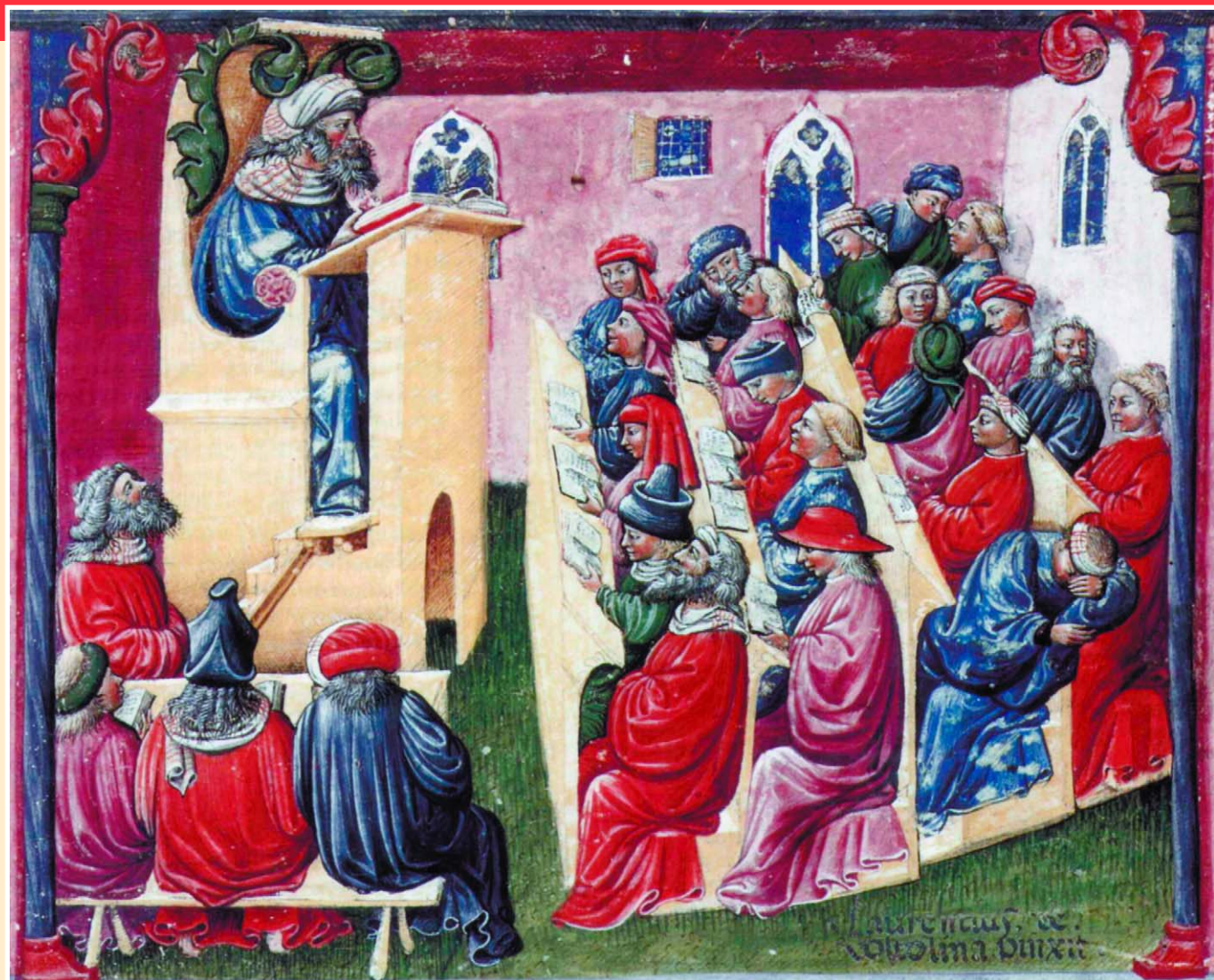
Лекция в средневековом университете. Миниатюра из французского манускрипта, XIV в.

Здравствуй, университет, мудрости обитель! Здравствуй, разума чертог! Пусть вступлю на твой порог с видом удрученным, но пройдет ученья срок, — стану сам ученым. Мыслью сделаюсь крылат в гордых этих стенах, чтоб открыть заветный клад знаний драгоценных!