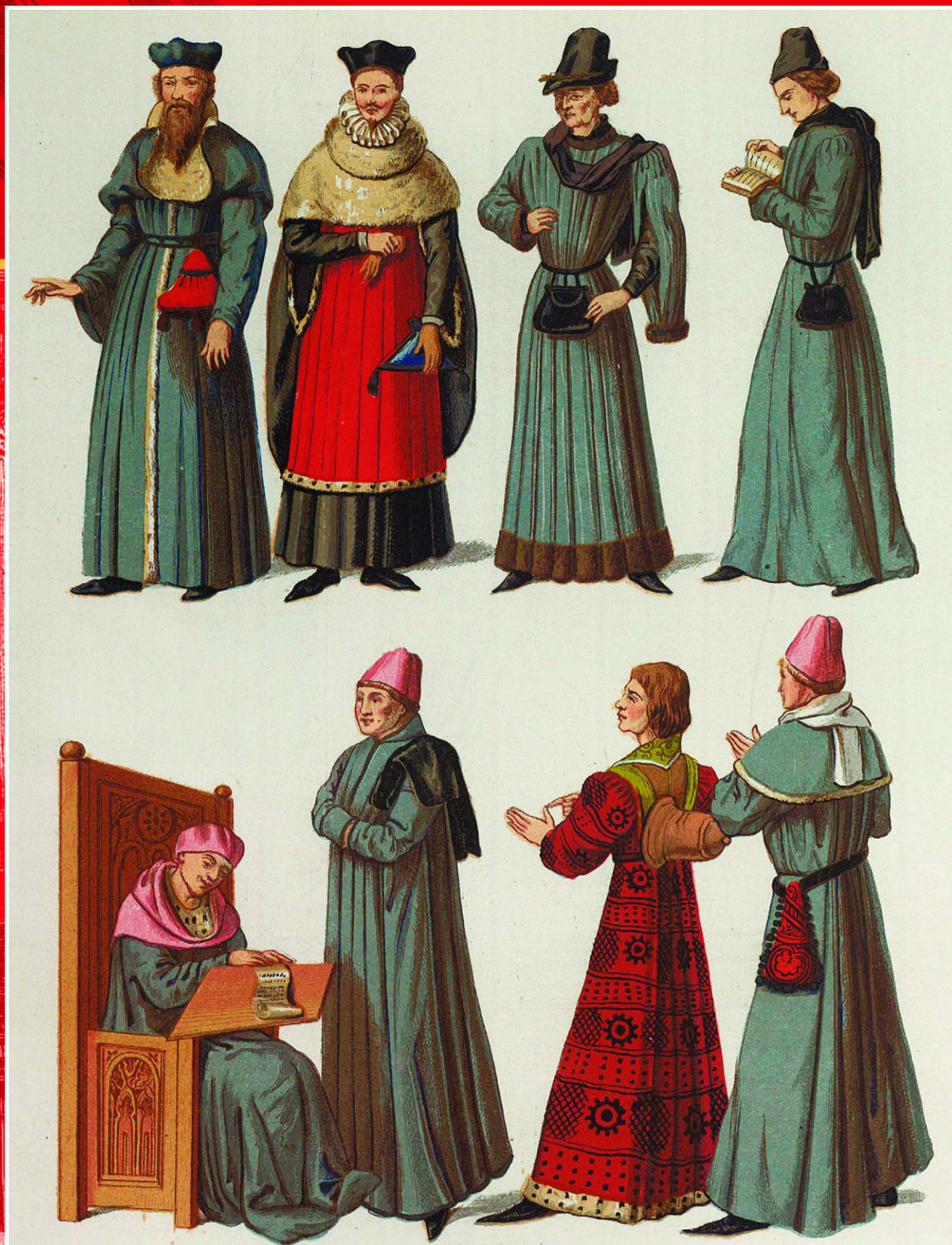
Доктора и ученые. XIV, XV, XVI вв.

ло. Расчет был на то, что человек, окончивший или хотя бы частично прошедший университетский курс, мог сделать солидную карьеру — образованные люди требовались в различных областях.