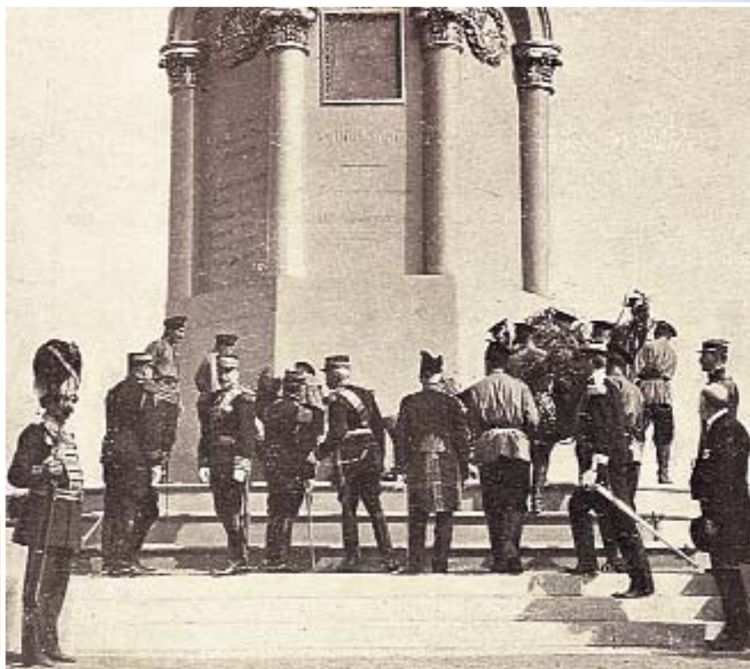
Члены французской делегации у Главного монумента. Бородино, 25 августа 1912 г.

Вечером крестный ход направился к Спасо-Бородинскому монастырю, а войска были расквартированы