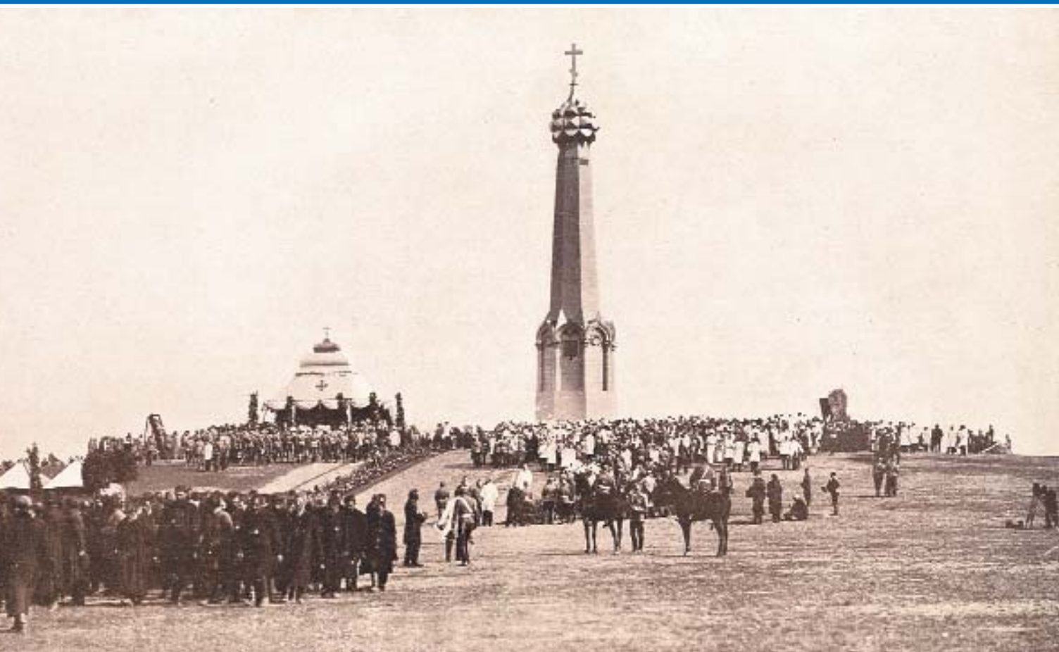
Церемония у Главного монумента героям Бородинского сражения. Слева от него – походная церковь Александра I. Бородино, 25 августа 1912 г.

всем протяжении их следования к местам назначения. Большие усилия были затрачены на организацию мест полевого размещения войск и многочисленных гостей.