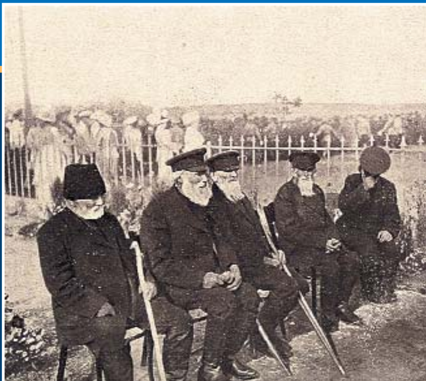
Ветераны Отечественной войны 1812 г. Бородино, 25 августа 1912 г.

ордена святого Георгия Победоносца – высшей воинской награды того времени. Строительство велось на средства солдат и офицеров тех воинских частей, которые в 1812 году принимали участие в битве. Также в помещении вокзала станции Бородино устроили небольшой мемориальный музей, посвященный Бородинскому сражению.