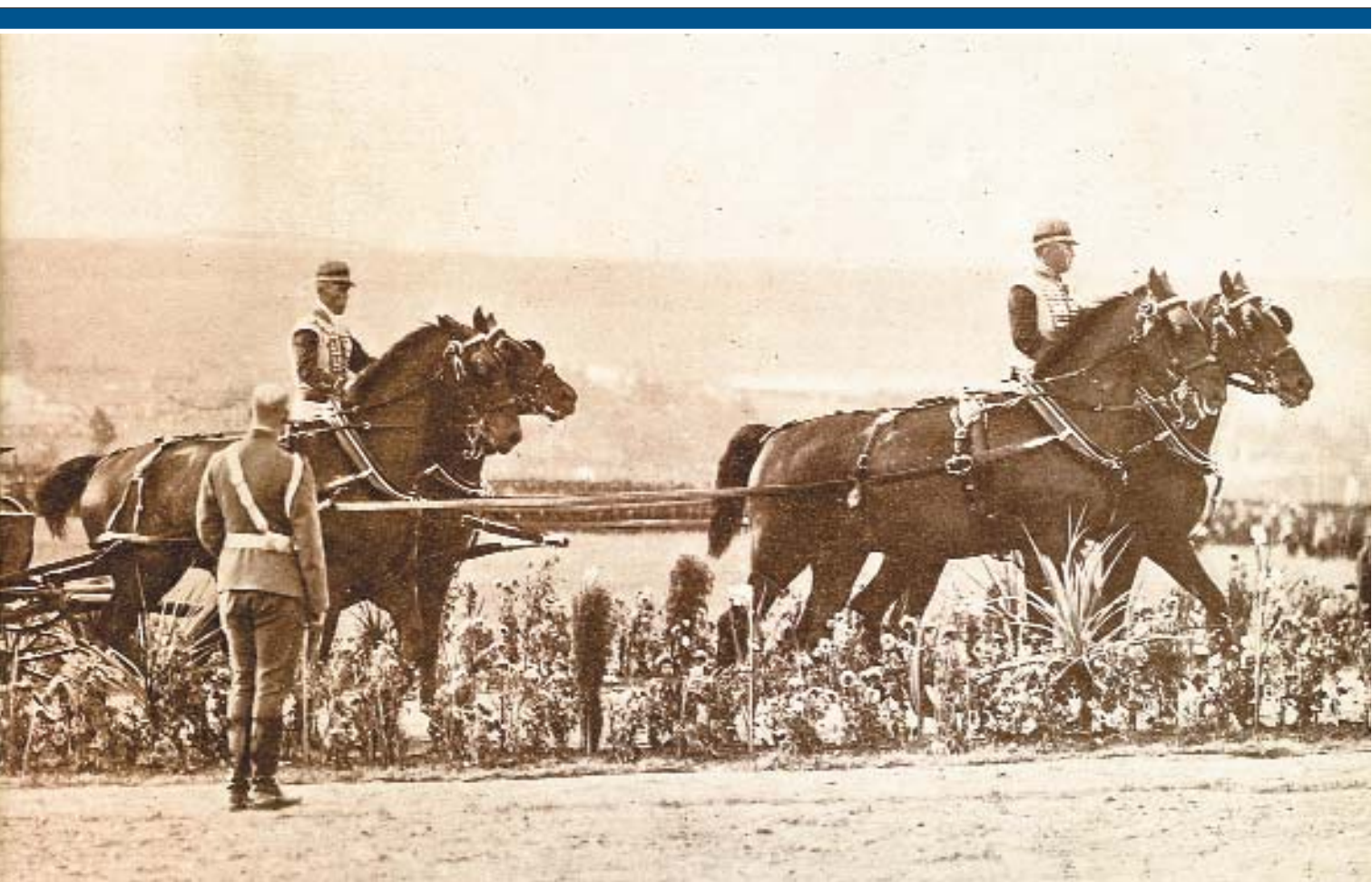
Императрица Александра Федоровна и цесаревич Алексей Николаевич в сопровождении статс-дамы и офицеров участвуют в крестном ходе на Бородинском поле. Бородино, 25 августа 1912 г.

Семеновские флешы, батарея Раевского); построены мосты и отремонтированы дороги вокруг Бородинского поля, а также проложены новые дороги между отдельными мемориальными местами; произведен ремонт Главного монумента; приведена