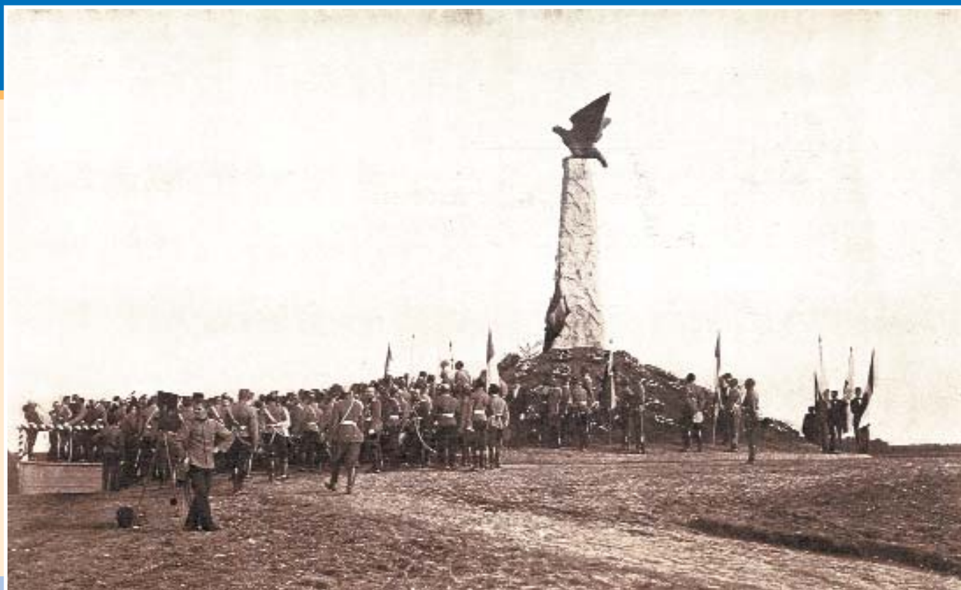
Открытие монумента героям Великой армии Наполеона. Бородино, 26 августа 1912 г.