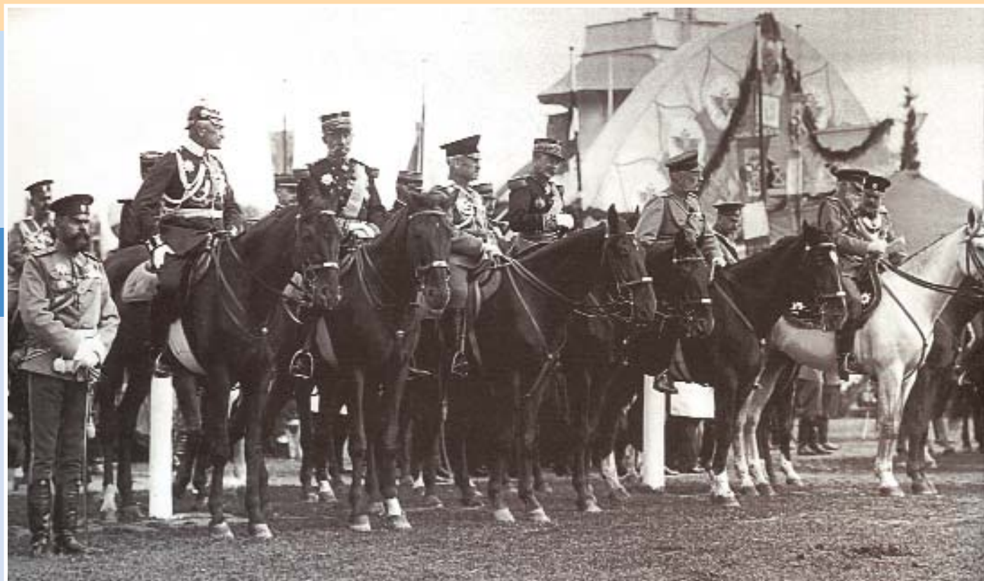
Представители иностранных государств на Ходынском поле во время смотра войск. Москва, 28 августа 1912 г.