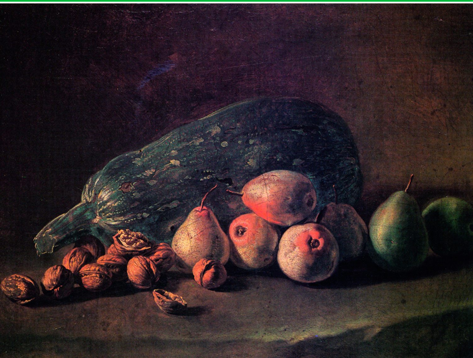
Натюрморт с фруктами. Худ. Джакомо Черути. Пинакотека Брера, Милан.

специй (это блюдо подавали даже в самых знатных домах). Кроме того, ломтики тыквы, смоченные яйцом и посыпанные сухарями, жарили в масле и продавали прямо на улице!