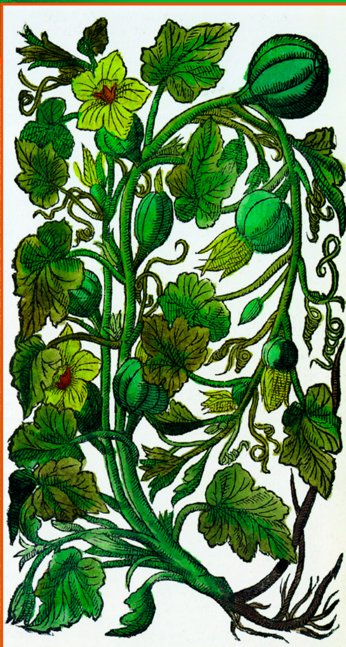
Pepo indicus (Тыква индийская). Иллюстрация из книги Джона Джерарда «История растений» (1627 г.)

водоемов полям. Как следствие, выросло и количество выращиваемой тыквы, которую стали есть практически все слои общества, в случае нужды заменяя сытным овощем мясо или хлеб. Примечательно, что именно тогда начались и первые селекционные опыты, благодаря которым сегодня мы имеем бесчисленное множество разновидностей тыквы, чьи форма и цвет поражают своим разнообразием.