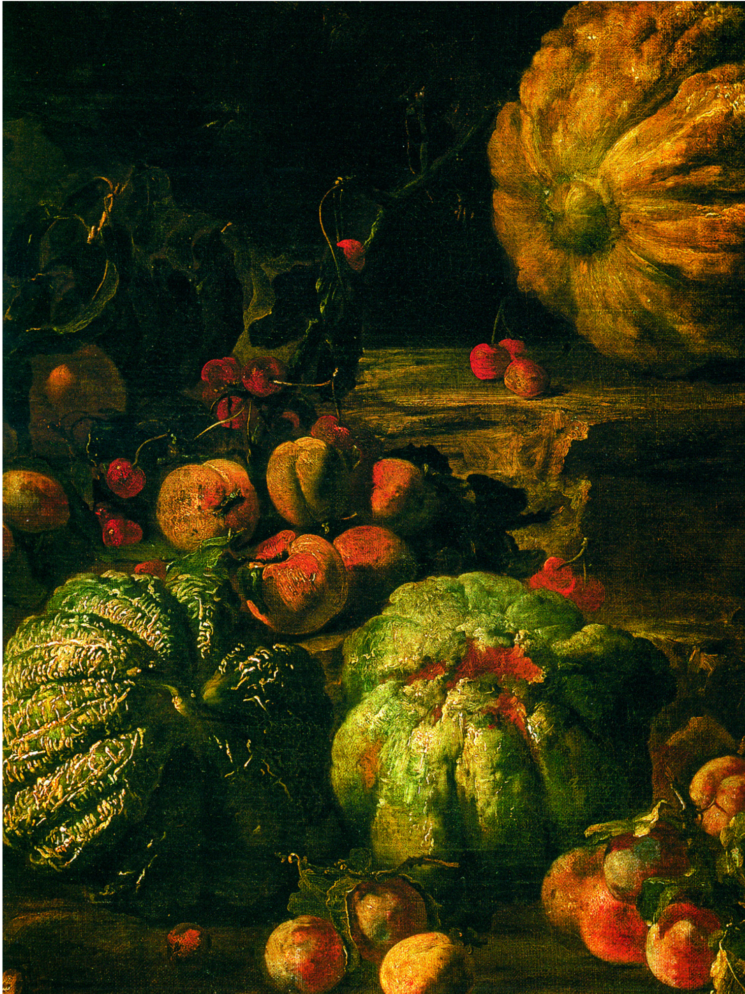
Натюрморт с тыквой. Худ. Микеле Паче. Государственный Эрмитаж, Санкт-Петербург.