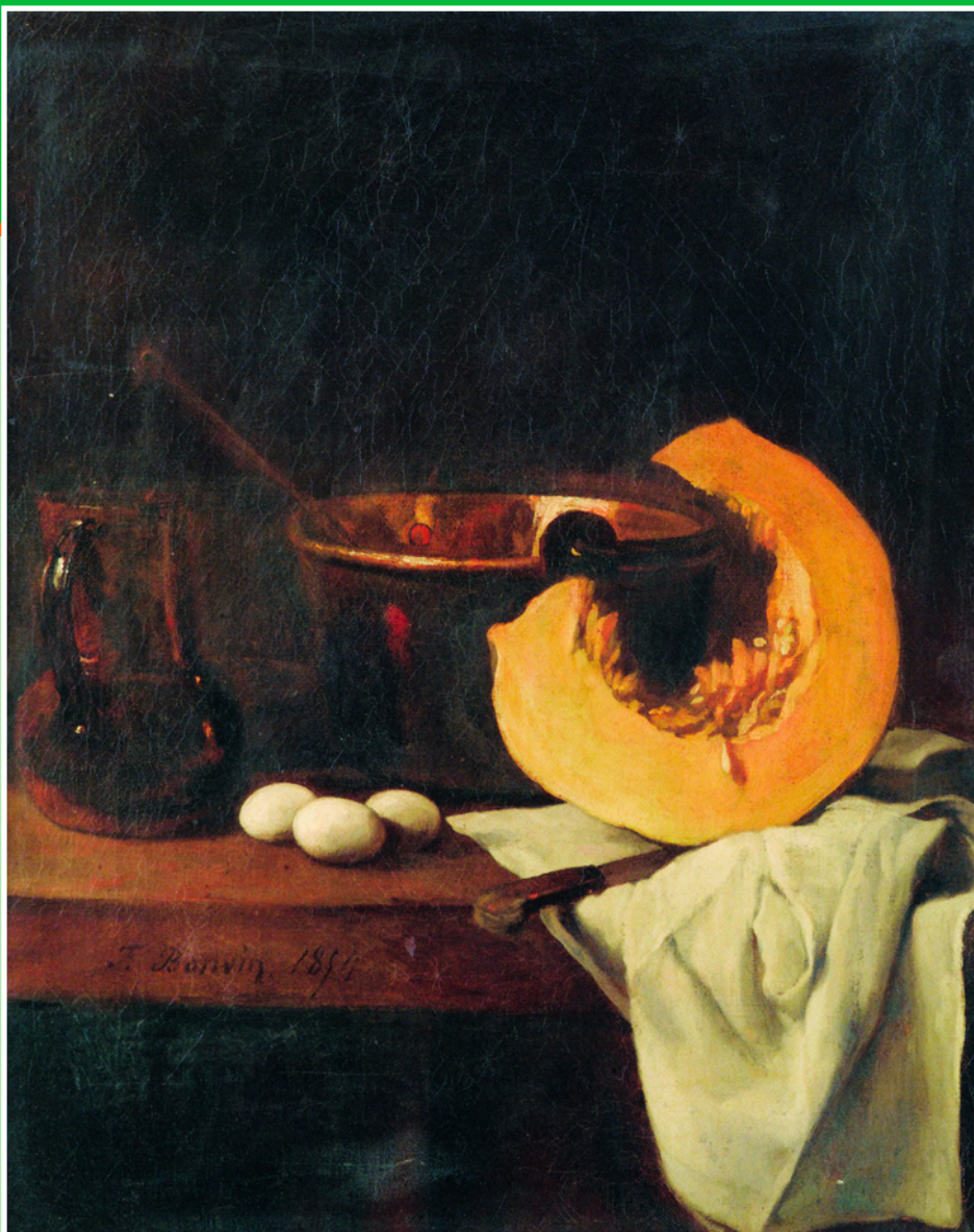
Натюрморт с тыквой и яйцами. Худ. Франсуа Бонвен. 1854 г. Галерея аукционного дома Sotheby's, Лондон, Великобритания.

приправленная кориандром, жгучим перцем и мятой. Он же предлагал подавать сладковатый по вкусу овощ с прославленным гарумом – соусом из жирных сортов рыбы, уксуса, вина, оливкового масла, соли и ароматических трав.