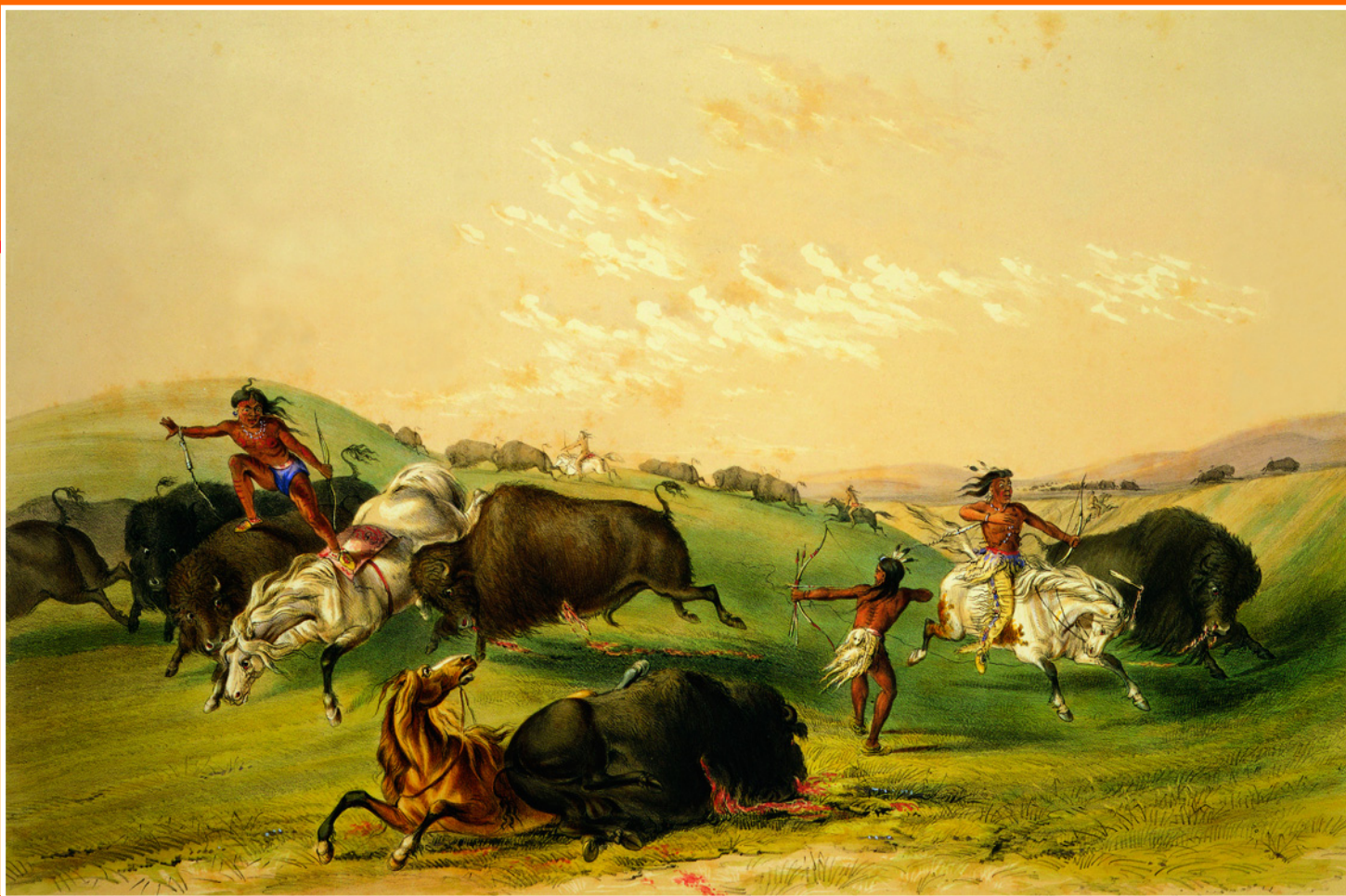
Охота на бизона. Худ. Джордж Кетлин. 1832 г. Смитсоновский музей американского искусства, Вашингтон, США.

ской лечебнице Сантьяго, выслан во Францию.