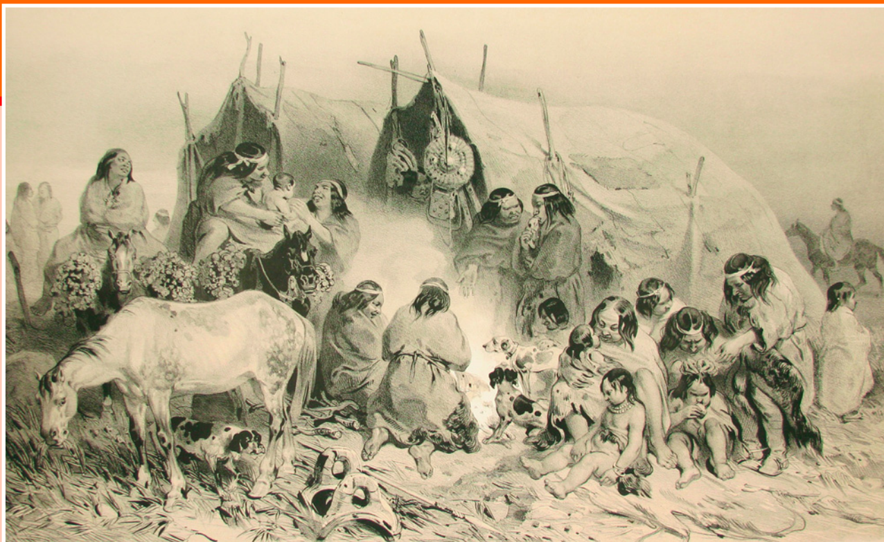
Иллюстрации на странице: Индейцы мапуче. Худ. Луи Ле Бретон. Иллюстрации к книге Жюль Дюмон д'Юрвиля «Путешествие к южному полюсу и в Океании на корветах «Астролябия» и «Усердный», издание 1846 г.

городе Баия-Бланка, и снова депортировали во Францию, где 17 сентября 1878 года Орели-Антуан де Тунан умер. Ему исполнилось 53 года. Но