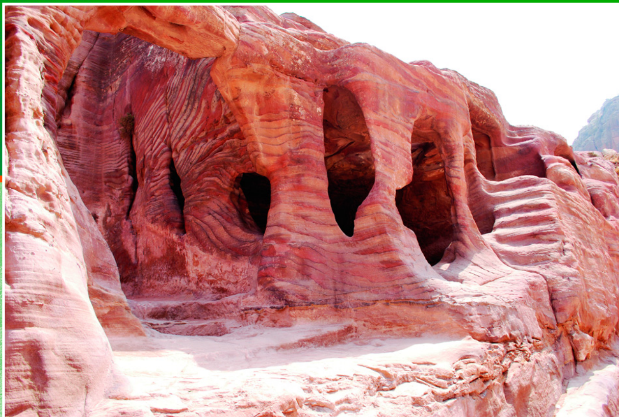
Иллюстрации на странице: Элементы архитектуры Петры.