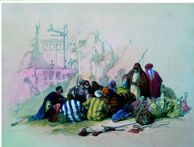
Привал бедуинов в Петре. Худ. Дэвид Робертс. 1829 г.

Среди исторических памятников город Петра, расположенный в глубине скалистой пустыни, на высоте более 900 метров над уровнем моря, и бывший в древности столицей древних царств Идумеи (XVIII – II века до н.э.) и Набатеев (II век до н.э. – 106 год н.э.), возможно, один из самых неповторимых. В зависимости от времени суток и сезона его дворцы, храмы, театр, гробницы, высеченные в камне и хорошо сохранившиеся, окрашиваются то в розовый, то в темно-