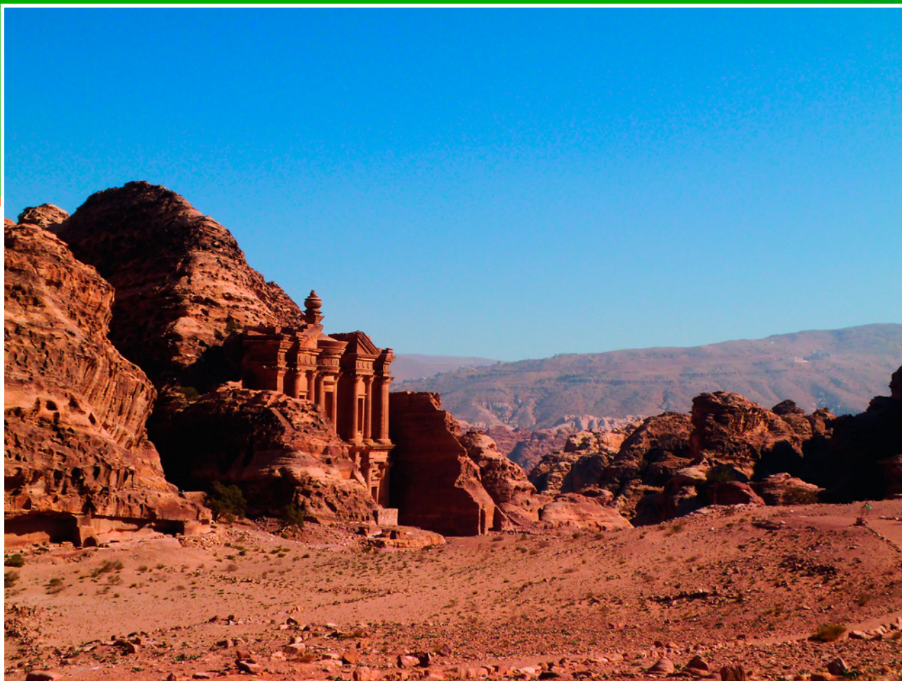
Набатейский храм-мавзолей Эль-Хазне в Петре.

Фасад монументального здания, целиком вырезанного из скалы в I веке, составляет 40 метров в высоту и 25 метров в ширину. Согласно одной из версий, храм выстроил набатейский царь Арефа IV Филопатр в качестве собственной усыпальницы.