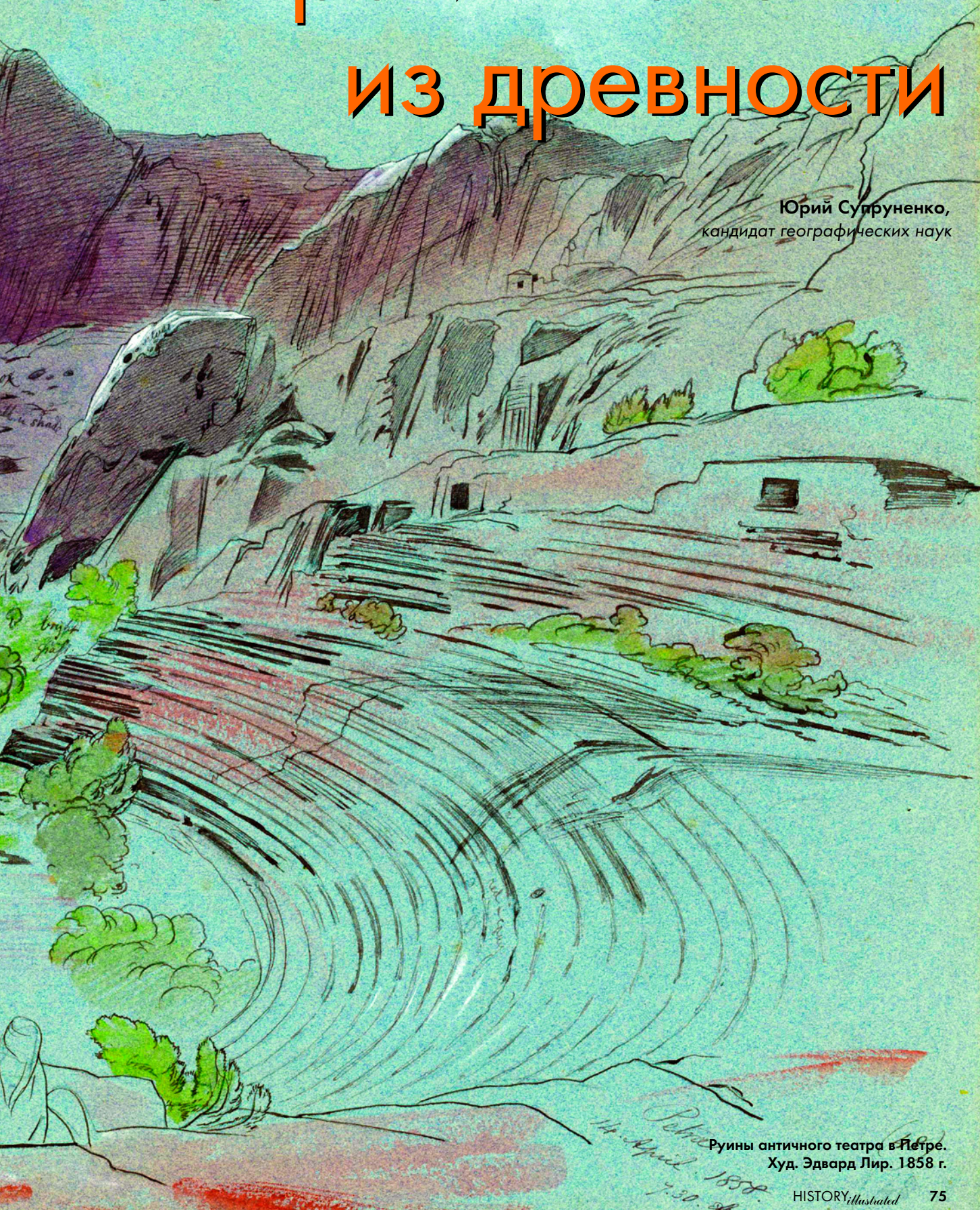
Руины античного театра в Петре. Худ. Эдвард Лир. 1858 г.