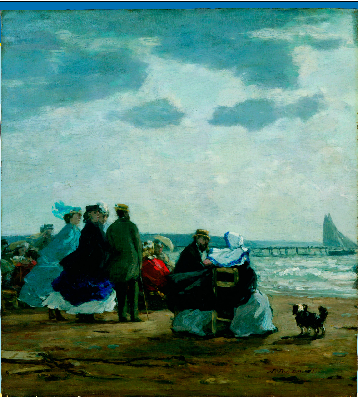
Пляж в Дьеппе. Худ. Эжен Буден. 1864 г. Музей Метрополитен, Нью-Йорк, США.

лишь променады вдоль берега, выступили французы и англичане. «Пляжная революция» в Европе произошла, когда в 1788 году граф де Бранкас открыл во Франции морское купальное заведение, протянувшееся по нормандскому побе-