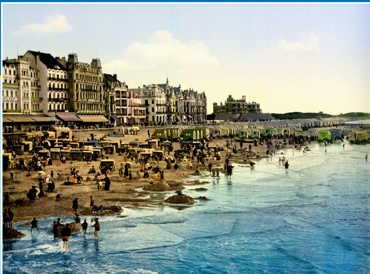
Пляж на берегу Северного моря в бельгийском городе Остенде. 1890-е гг.

В XVIII и XIX вв. купальные машины, как их тогда называли, представляли собой крытые домики-повозки с деревянными или брезентовыми стенками. Купальни были передвижными, в воду их завозили лошади или закатывали слуги, после чего разворачивали так, чтобы купальщик не был виден с берега.