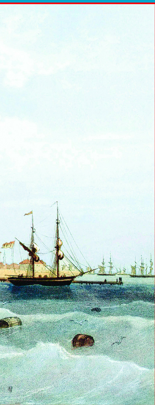
Пляж в Евпатории. Худ. Карло Боссоли. Литография 1856 г.

Характеризуя никчемного человека, эллины говорили, что «он не умеет ни читать, ни плавать». В ходу была эта сентенция и в Риме. «Римляне в течение шести столетий обходились без врачей благодаря плаванию и купанию», – утверждал и римский писатель Плиний, имея в виду, как знаменитые римские термы, так и морские моционы.